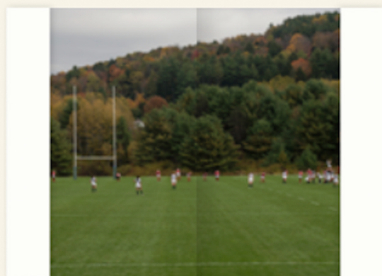
Interior carpeta con solapa cerrada