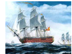
Trafalgar y el Stma. Trinidad

Organizado por el colectivo universitario "Bahía de Cádiz XXI" y la Facultad de Ciencias Náuticas de la Universidad de Cádiz.