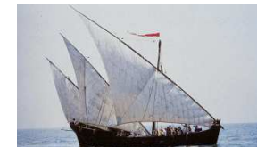
Carabela La Niña