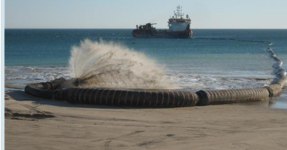
Foto 21 de junio de 2008. Los trabajos para la regeneración de la playa de El Palmar han aportado 595.000 m 3 de arena que se han obtenido del dragado de la zona del placer de Meca. La Demarcación de Costas Andalucía Atlántico ha escogido la fecha de la actuación de manera que no interfiera en la campaña del atún rojo de acuerdo con el calendario de las almadrabas de la zona del placer de Meca, tras valorar las recomendaciones ambientales de todas las partes implicadas.

Colabora enviándonos tus fotos a gestioncostera.cadiz@uca.es