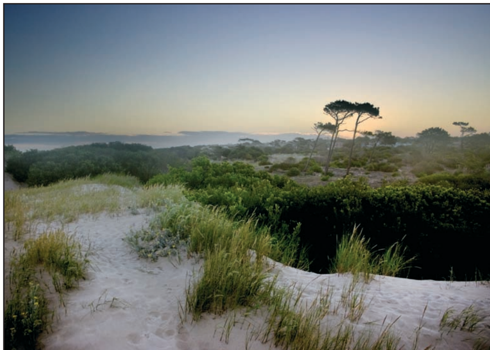
El Pinar, Uruguay ( M. Gómez )