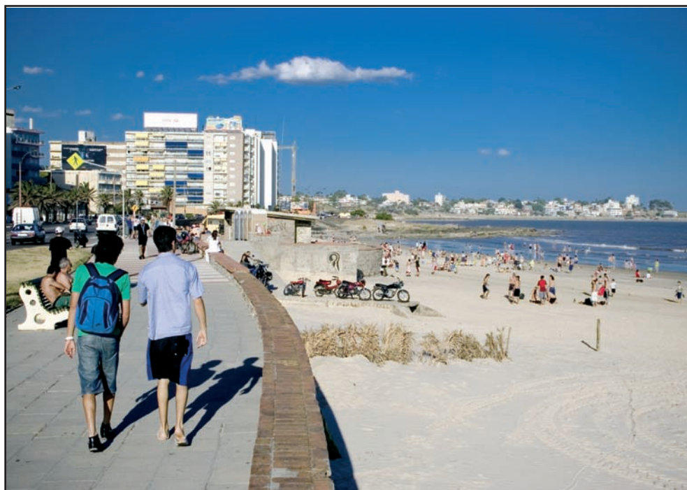
Playa de Montevideo, Uruguay ( M. Gómez )