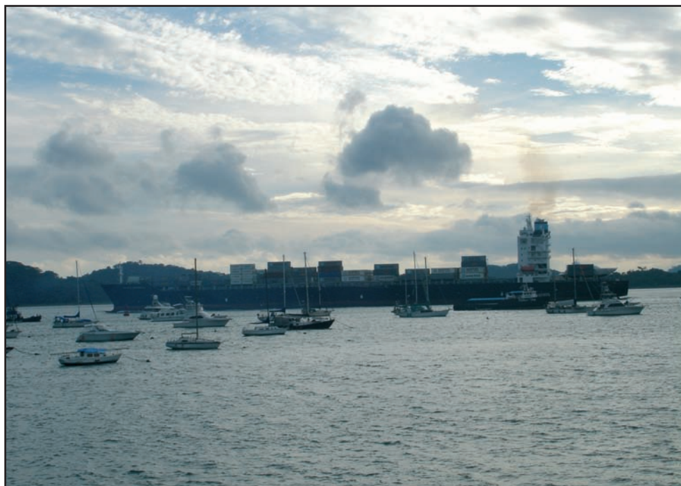
Sector del Canal de Panamá, Ciudad de Panamá ( P. Arenas )