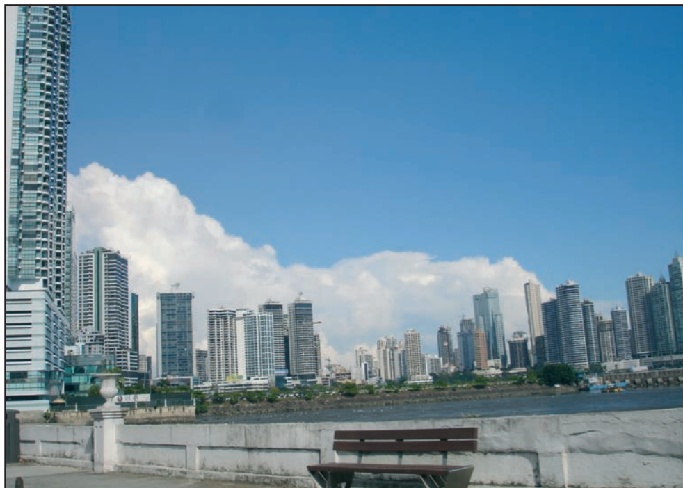
Ciudad de Panamá, Bahía de Panamá, Panamá ( H. Garcés )