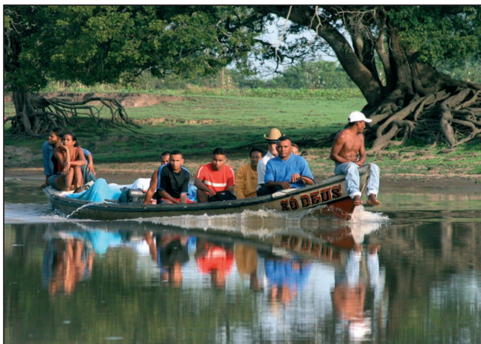
Arquipélago do Marajó, maior arquipélago flúvio-marítimo do mundo, Brasil (M. Von Behr)