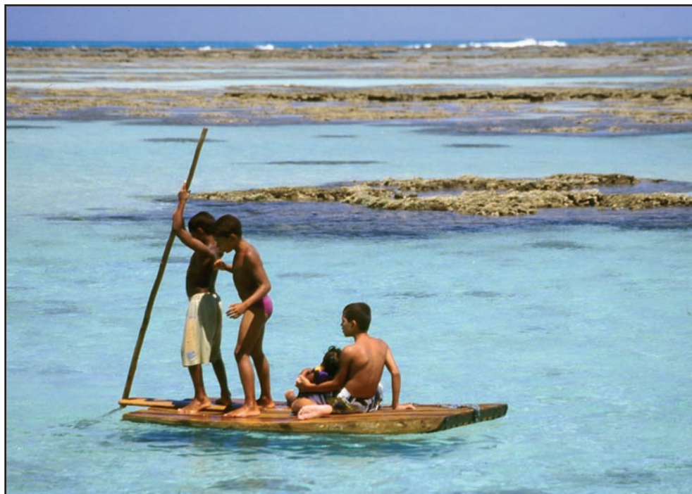
Crianças e recifes de corais, litoral de Alagoas, nordeste brasileiro (M. von Behr)