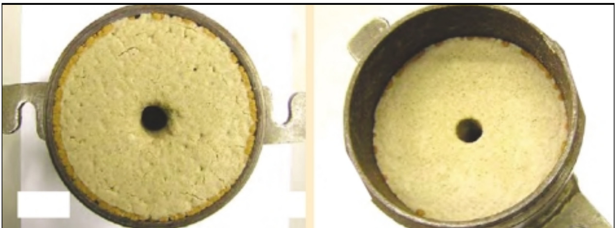
FIGURA 2 Caras delantera y trasera de la muestra antes del ensayo.