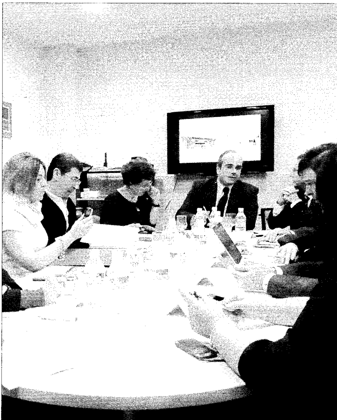
EDUCACIÓN. reunión del Patronato del Campus Tecnológico.

"Ahora hablamos de realidades y de compromisos que se cumplen, por lo que hay que agradecer a la Junta de Andalucía así como a la Mancomunidad y a la Universidad su apuesta por este proyecto, de gran importancia para la ciudad", dijo Herrera.